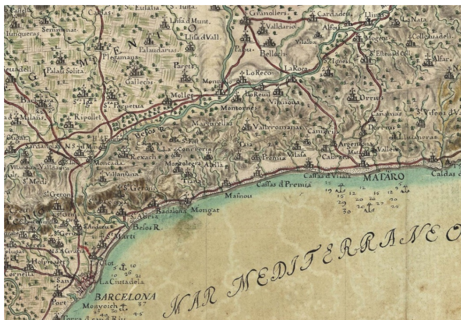
Fragment del Mapa del Corregiment de Mataró (año 1726), obra de Oleguer de Taverner i d'Ardena (? 1676 - Barcelona, 1727)

Os invitamos a participar en las actividades.