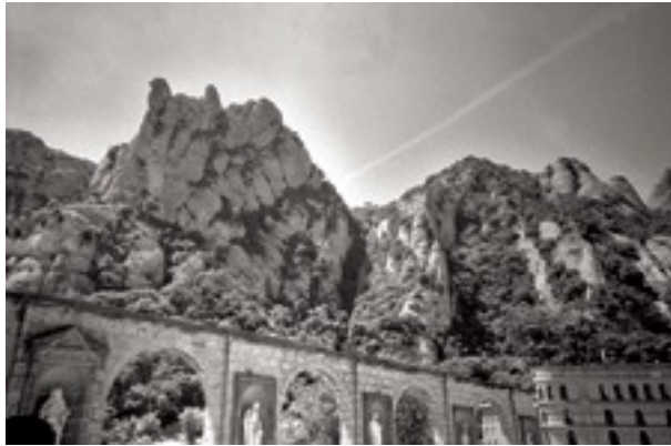
Montaña de Montserrat

Cuando nos alejamos de la montaña por el entrañable camino dels Degotalls nos alejamos de la montaña por la cara del Bruc para encontrarnos con la localidad de Castellolí y finalmente llegaremos a la ciudad de Igualada. L'Hospitalet y Montserrat nos quedan en el recuerdo.