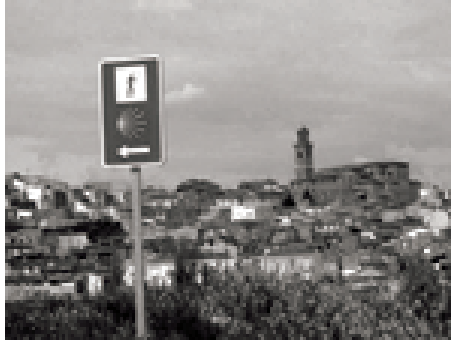
Imagen del camino del Ebro por tierras Riojanas

Segunda ciudad de Navarra tiene títulos de «muy noble y muy leal» y es la capital de la comarca de la Ribera. Su sede episcopal y su catedral (s. XII) son una joya patrimonial de la ciudad.