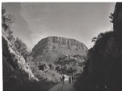
El famoso cañón del Colorado

(Calle de Can Paloma) la cual más adelante enlazará con la carretera B 113 que nos llevará a dar a la carretera C-55 la cogeremos a nuestra derecha (dirección a Abrera) y avanzaremos unos 500 mts. y cuando veamos el enlace con La Puda cruzaremos la C-55 y seguiremos por un camino asfaltado que luego será de tierra que sube a nuestra derecha contando que es una fuerte subida hay que tomar bastante oxígeno para poder subirla una vez arriba nos bajaremos por el camino de nuestra izquierda es un camino bastante empedrado siempre siguiendo las señales pasaremos por medio de unas montañas que las hemos bautizado como el cañón del colorado por su parecido a las películas de indios y vaqueros que se hacían antiguamente. Seguiremos recto siguiendo las señales y paralelo a la derecha la vía del ferrocarril y a la izquierda el río Llobregat siempre iremos recto a nuestra derecha hasta llegar al puente del aéreo aquí tenemos un Bar que según que hora sea podemos coger avituallamiento. El camino nos llevara a la población de Monistrol pasando primeramente por delante de una depuradora y a la altura del puente grande que cruza el Llobregat nos desviaremos a la derecha para subir hacia arriba para entrar en Monistrol por la calle del Pla con la confluencia de la calle Santa Ana allí nos encontramos una fuente seguiremos la calle y giraremos a la izquierda para cruzar el puente del río y cogeremos la BP-1121 que tras unos 9 kms. nos llevará al Monasterio.