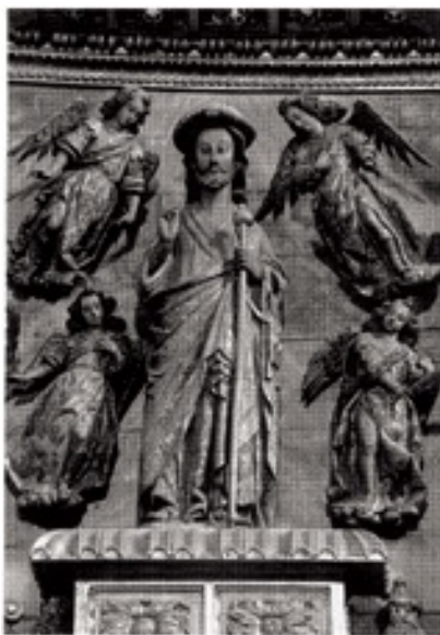
Imagen de Santiago de la iglesia de Santiago el Real