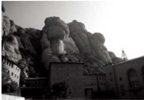
La Abadía de Montserrat