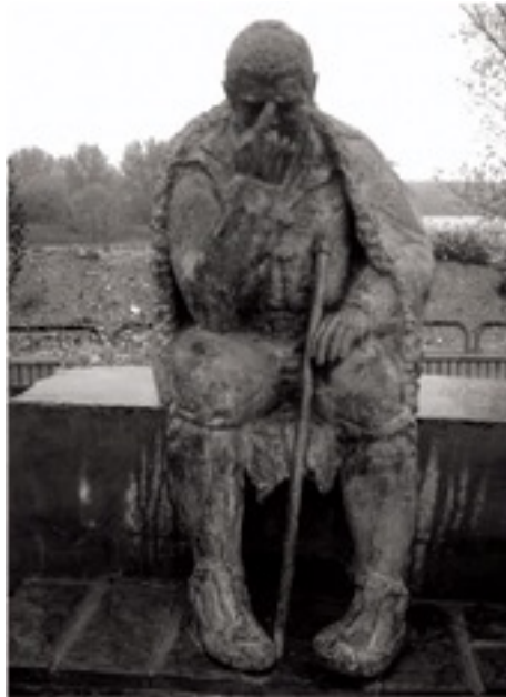
Estatua de Sancho Panza Pensador en Alcalá de Ebro

Dónde Informarse: Ayuntamiento 976 616 275