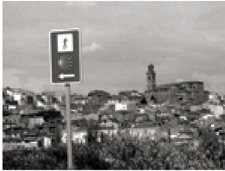
Imatge del camí de l'Ebre per terres De La Rioja

Segona ciutat de Navarra té títols de «molt noble i molt lleial» i és la capital de la comarca de la Ribera. La seva seu episcopal i la seva catedral (s. XII) són una joia patrimonial de la ciutat.