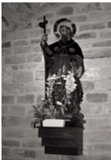
Imatge de Sant Jaume a Pallerols

Sortim pel costat de l'esquerra de les cotxeres, alcostat d'una ermita blanca ens trobem un camí carreter sense asfaltar haurem que seguir -ho una bona estona. Arribarem a un camí asfaltat i girarem a la dreta sense deixar el camí que ens portés a la localitat de Pallerols.