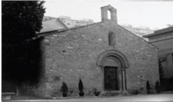
Iglesia de Santa Eulalia de Provençana

Santiago de Compostela a aquesta alçada hi ha 2 Km Maestro Candi, Rodes, plaza Mestre Clau i a la dreta deixem la Tercera Gasolinera , avenida Fabregada , San Antoni ,Pau Casals , Vigo , Rambla Just Oliveres .dejamos el carrer d'Enric Prat de la Riva per agafar el carrer Major per dirigir -nos a l'ajuntament per continuar fins al carrer Femadas.