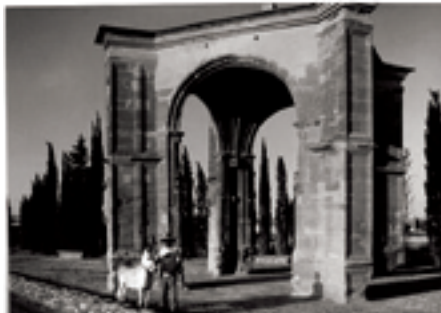
Vista de Calahorra

Qué veure: el Monestir de San José «Fundés aquest convent a la ciutat de Calahorra de religioses Descalces de l'ordre de La nostra Senyora de la Muntanya Carmelo, la vocació de la qual és del senyor San José...»