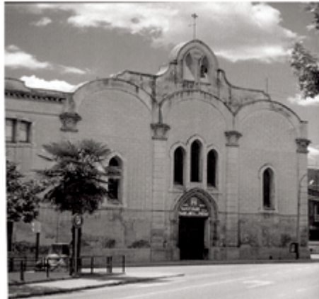
Vista del Santuari de la Mare de Déu de la Pietat d' Igualada

La primera part d'aquesta etapa està dominada per llargs contactes amb la N-II que ens acompanyarà fins a Saragossa. Explica l'obertura de l'autovia es pot transitar molt millor el tram de Jorba a la Panadella que ha quedat per als pelegrins. A partir de la Panadella trobarem la tranquil·litat dels pobles de la Ribera d'Ondara. Visitar la població de Pallerols i la seva església us encantarà.