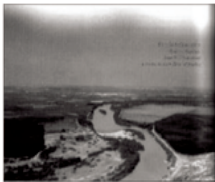
Vista del vall de l' Ebre des de la Talaia soto Candespina y Torres de Berrellén (al Fons)

Sortida per la plaça del Pont Alt , deixem les escoles a l'esquerra i agafem el carrer Garfilan i un agradable camí agrícola.