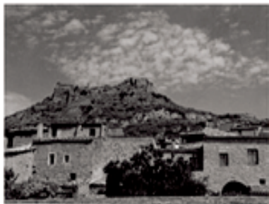
Castell de Jorba

Trobarem una font l'aigua aquesta esplèndida, creuarem el poble sempre seguint els senyals i seguirem recte fins a Jorba