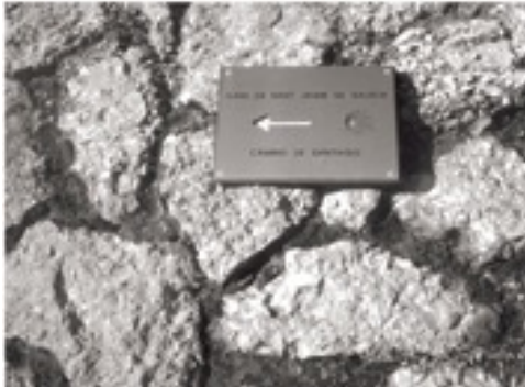
El Camí de Sant Jaume