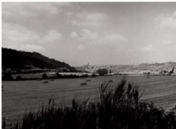
Vista panoràmica de Cervera

Des de la font de Fiol seguim la pista fins a Cervera .