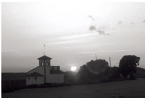
Ermita a l' area de servei del Ciervo

Sortim a la N-II i l'agafem cap a l'esquerra creuant el poble i després de l'última gasolinera al punt kilomètric 390,5 agafem un camí que deixa la carretera nacional a la nostra esquerra, en el punt kilomètric 386,5 de la N-II creuem la carretera i seguim el camí paral·lel en l'altra banda, Ermita de San Jorge.