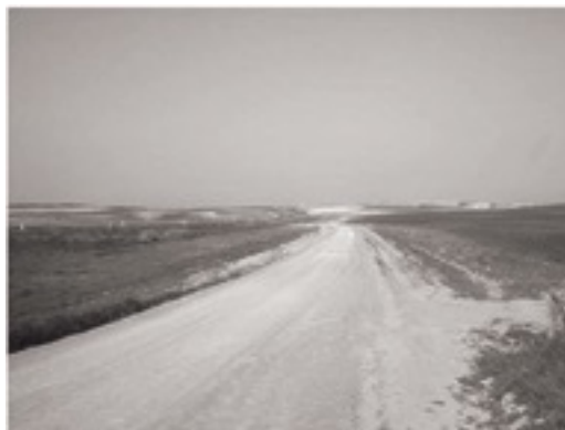
Camí del Ventorrillo

Hem de seguir la travessia de la carretera fins al punt kilomètric 434, encreuament amb la carretera de Mequinenza a Osca . Seguim cap a la dreta en direcció a Osca uns 200 metres, passem un petit pont i a l'esquerra, al costat de Grues Caps (carrer Monestir de Sigena), agafem el camí pel Barranc del Camí Vell que ens porta a uns camps de fruites, olivars i pins, en guanyar l'altiplà. És una ascensió llarga i dura, que deixa a les nostres esquenes l'horta de Fraga i davant de nosaltres una immensa planície que es perd a l'horitzó.