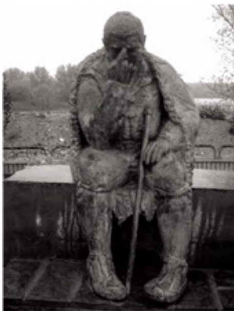
Estàtua de Sancho Panza Pensador a Alcalá d'Ebre.