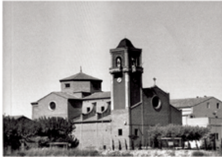
Vista panoràmica de l'església de Sant Miquel Arcangel de Bell-Lloc