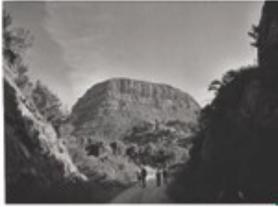
El famoso cañón del Colorado