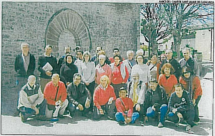
Un total de 25 persones van participar en el primer curs d'hospitalers de Catalunya a Pallerols.

Per atendre els pelegrins del Camí de Sant Jaume