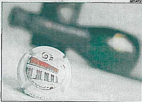
L'edifici de la Paeria, del segle XII, a la xapa del cava.